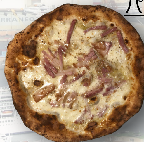
パンナ プロシュット コット 1600