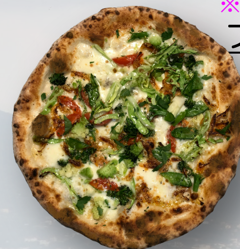
※3月～5月限定 プリマヴェーラ 1700