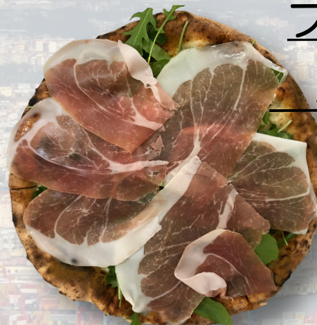
プロシュットエ ルーコラ 1900

モッツアレラ ゴルゴンゾーラ タレッジョ パルミジャーノ ハチミツ+100yen