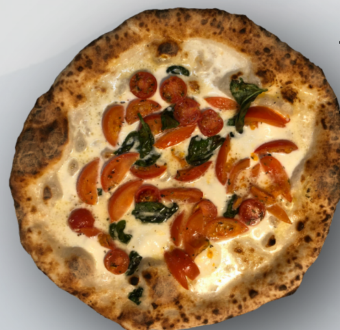
マルゲリータ エクストラ 1900